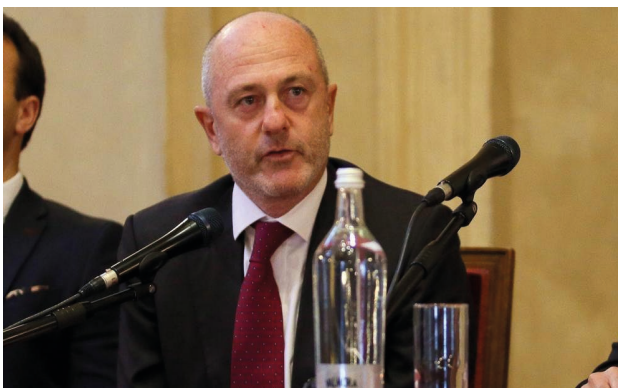
Angelo Binaghi - Presidente FITP